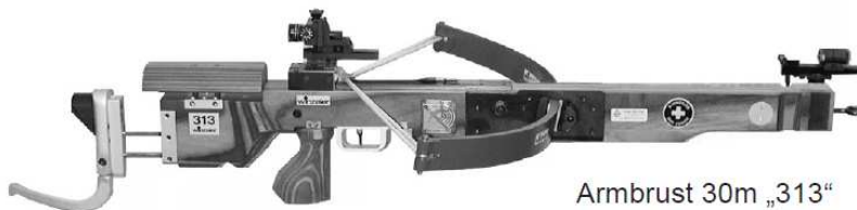
Armbrust 30m „313“