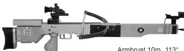
Armbrust 10m „113“